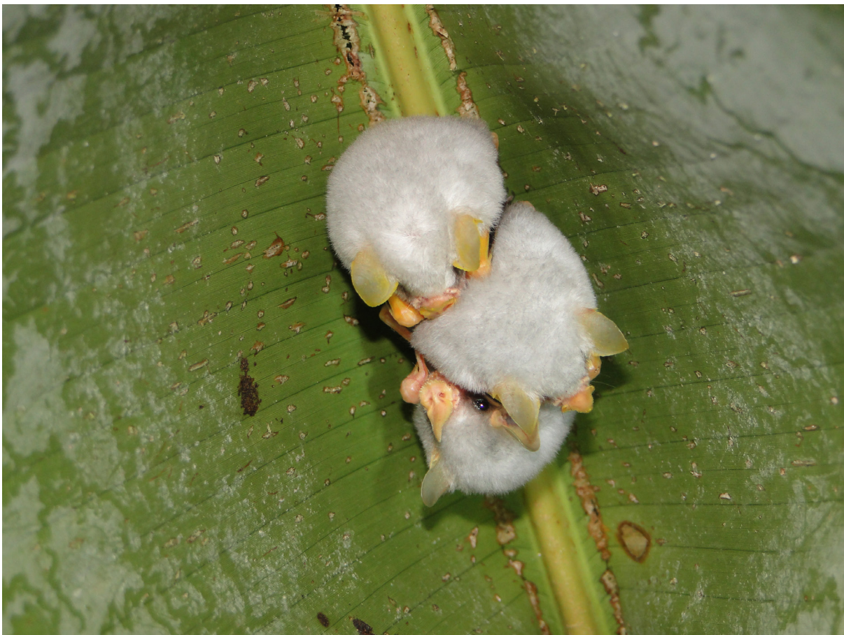
Figura 3. Tres individuos del Ectophylla alba (murciélago blanco hondureño), perchando en la hoja de platanillo.

brimiento del murciélago blanco viene aportar de manera significativa para Honduras el conocimiento de su distribución potencial. Para la región centroamericana contribuye a establecer los posibles límites y rangos de que va desde la Moskitia hondureña hasta la parte norte de Panamá. Para Honduras su distribución se restringe hasta este momento muy exclusivamente para la región de la Moskitia hondureña. Una amenaza fuerte que enfrenta el murciélago blanco es la destrucción de su hábitat por deforestación y conversión del uso de la tierra en el área de distribución. Es de suma importancia la continuidad del monitoreo del murciélago blanco en otras áreas protegidas de la región Moskitia como El Parque Nacional Patuca y La Reserva de Biósfera