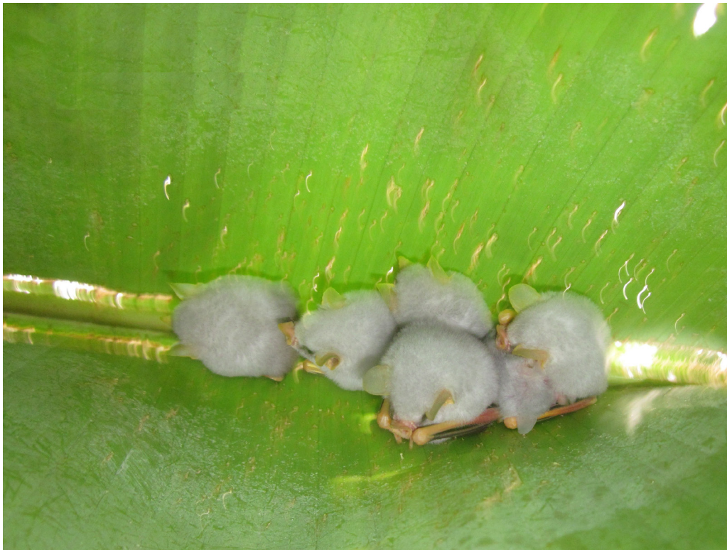
Figura 3. Grupos de cinco individuos (incluye una cría) de E alba en una tienda de platanillo en la localidad de Ibantara.

Tawahka Asagni y de esta forma conocer y ampliar su rango de distribución potencial y de esta forma establecer estrategias para su conservación en el país y la región centroamericana.