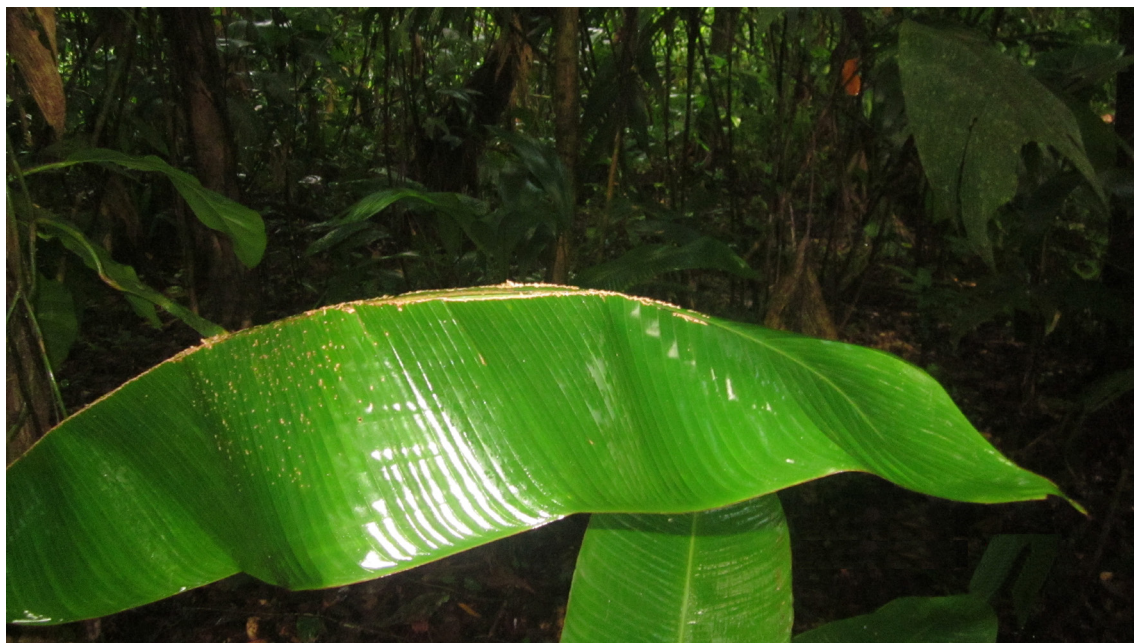
Figura 2. Imagen de Heliconia latispatha (platanillo) usada como tienda para percheo de Ectophylla alba a una altura de 1.55 mts del suelo, con una longitud de hoja de aproximadamente 87 cm por 25 cm de ancho. Nótese las perforaciones en la vena principal de la hoja hechas por los murciélagos para poder sostenerse al momento de perchar.